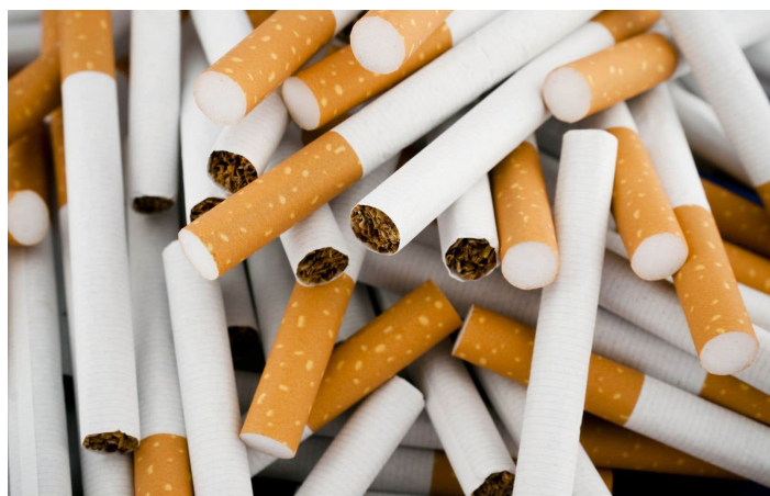
Les trois géants du tabac au Canada devront verser environ 17 milliards de dollars en dommages et intérêts à quelque 100 000 Québécois ayant souffert des ravages de la cigarette.